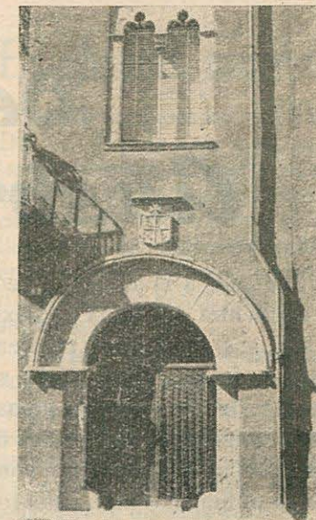
Casa llamada del Comendador Ulldecona

Del modo que se incluye y contiene en dicho término, con sus confrontaciones, entradas y salidas, derechos y pertenencias, aguas, pastos, maderas, caza, bosques, llanuras, rocas, montañas, pastos y pesqueras; con todos los baldíos, derechos y pertenencias que corresponden a dicha villa y su término; según mejor