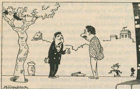
- Eso de casarte en martes y 13... - Mira, no me importa una fatalidad más.

Si necesita información complementaria acuda a la Agencia de Extensión, calle Argentina, n.º 22 - Teléf. 24 11 40. Nuestro servicio es gratuito.