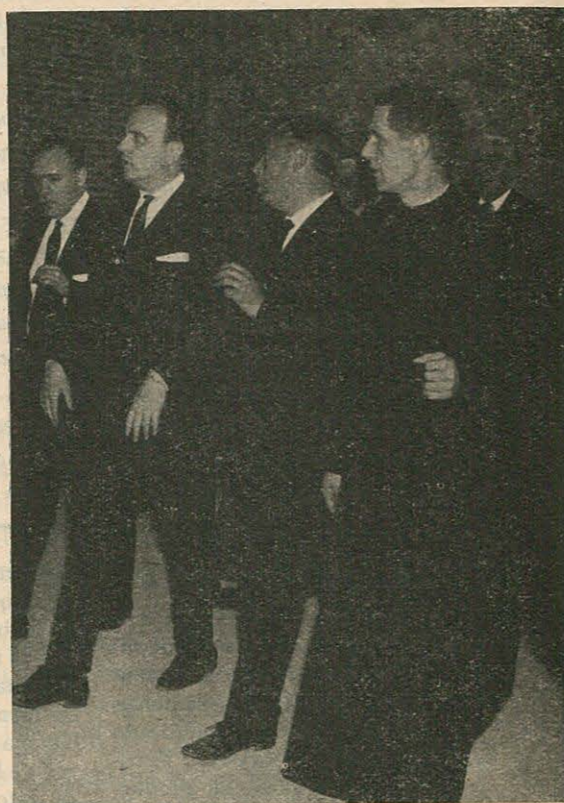
El Excmo. Sr. Ministro de Información y Turismo, D. Manuel Fraga Iribarne, durante su visita a las dependencias del teatro en donde se representa La Pasión, acompañado del Excmo. Sr. Gobernador, Presidente del Patronato, y Rvdo. Cura Párroco.

Será interesante ir a buscar la fuente, de lo que más arriba apuntábamos, que no puede ser otra, que una versión actualizada y consciente, de aquellas manifestaciones populares de arte religioso que en la edad media le daban en casi todos los pueblos de Cataluña, cuya versión plástica eran los «Miracles», «Pastorets», y «Misteris».