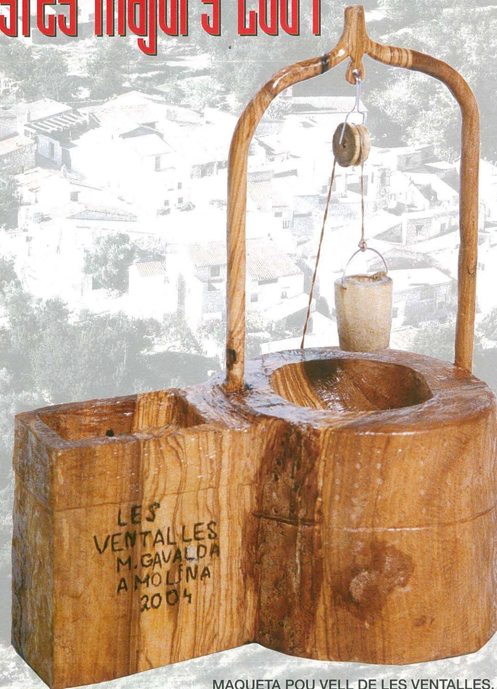
MAQUETA POU VELL DE LES VENTALLS, feta a mà per M. GAVALDÀ