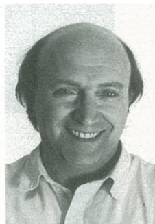
Josep-Lluís Millan, Cap de Llista d'ERC