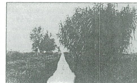
"Els diversos aspectes d'aquell inquietant paisatge"

agressiva i canviant que el fa innavegable. Ara unes golondrines et porten a passejar fins a la mar blava i t'expliquen com les illes s'han convertit en península i com el mateix riu ha tapat la seva sortida i ha tombat cap al nord, engreixant les terres de babor i descalçant les d'estribord, com ens deia amb bon vocabulari mariner el timoner de la golondrina. -O sigui,