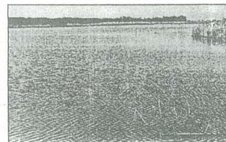
"Una quietud plana que deu amagar una força modificadora"