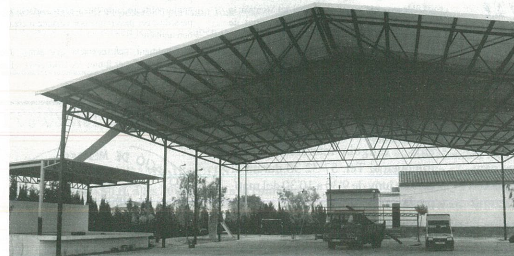
Pista Poliesportiva dels Valentins

Ara, enguany, es completa el tros que faltava.