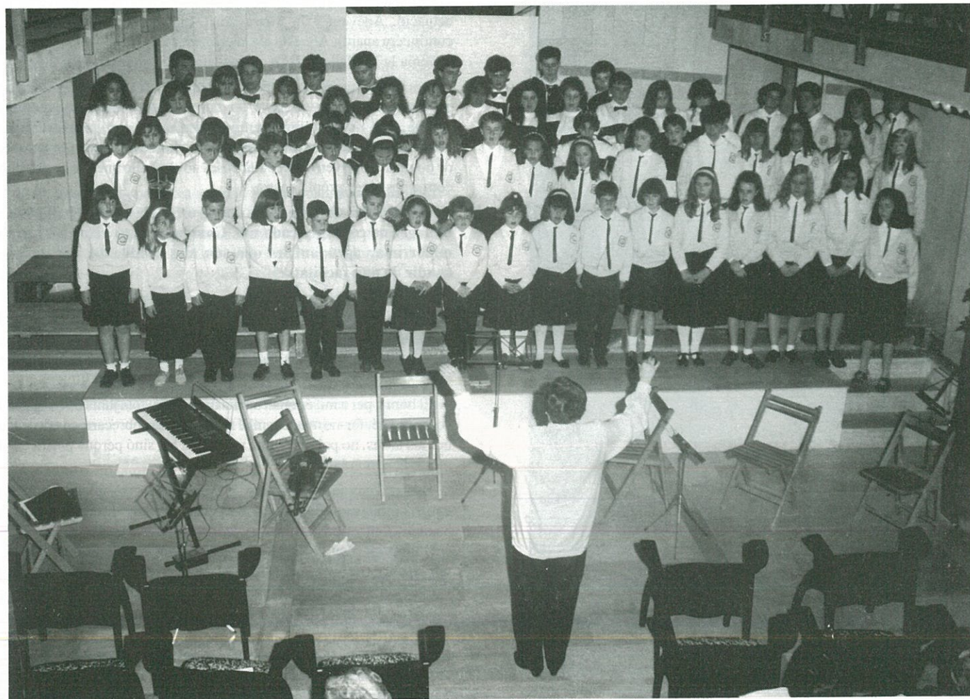
Rossinyols del Montsià

PROGRAMA de les activitats que se celebraran als Valentins, durant els dies 11 al 14 de juny, amb el motiu de les FESTES MAJORS, en honor a Sant Antoni de Pàdua.