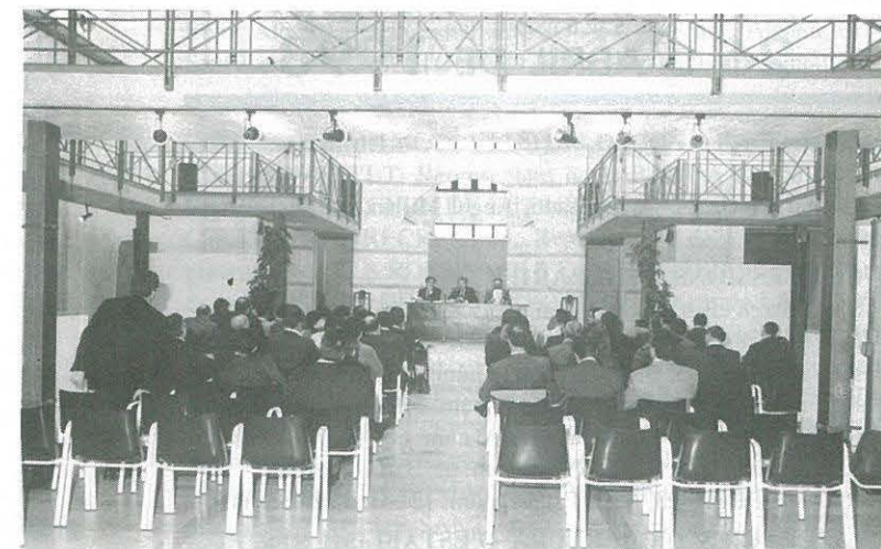
Els setanta representants d'ajuntaments es van reunir a la Casa de Cultura d'Ulldecona

□ Demanen per llei que l'Estat els compensi les bonificacions que atorga