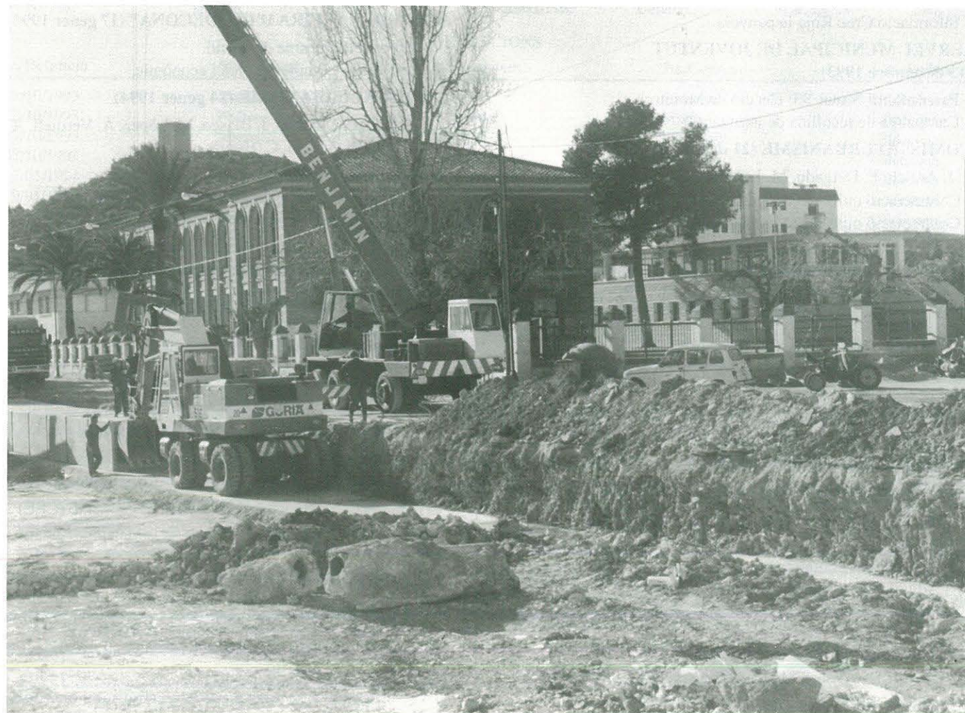
Treballs d'Urbanització Avgda. Escoles