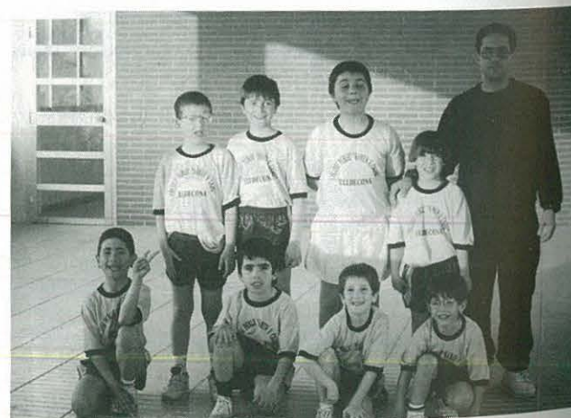
Equip Bàsquet Benjamí Masculí