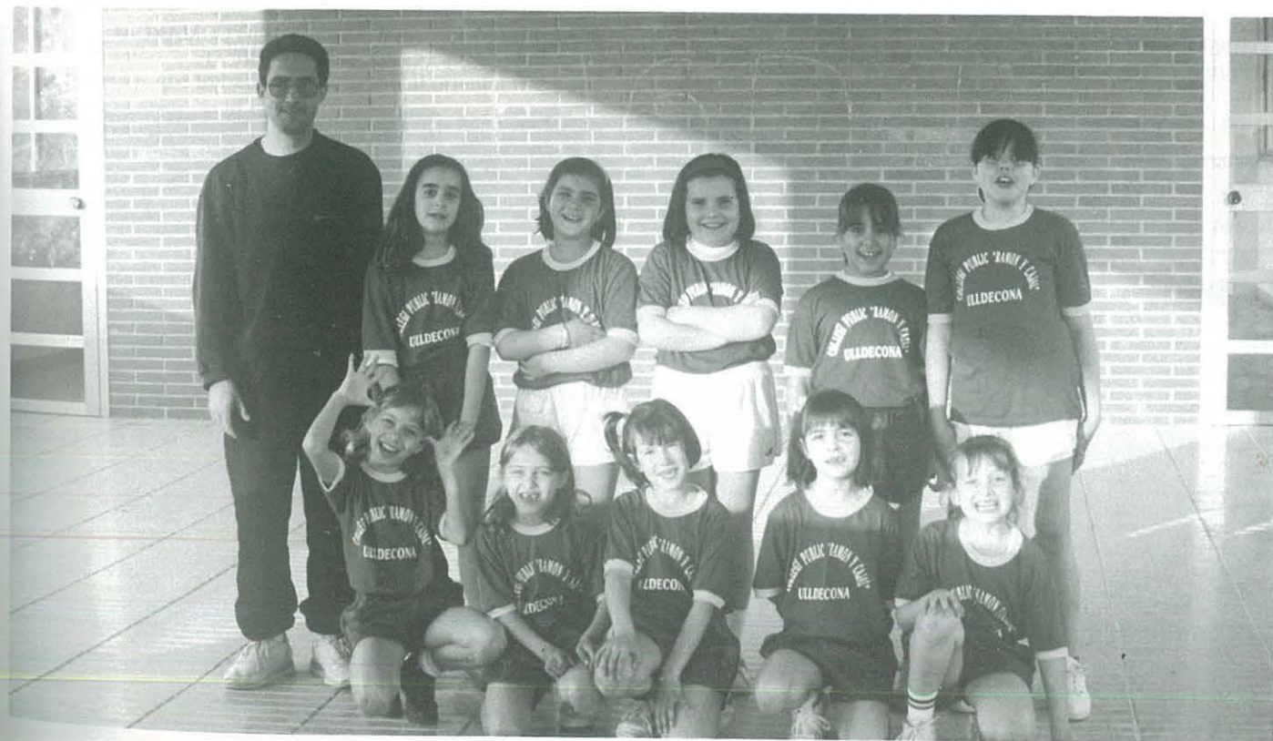
Equip Bàsquet Benjamí Femení