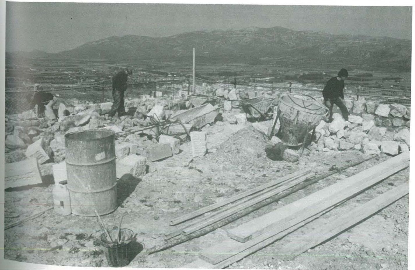
Restauració Torre-Palau del Castell d'Ulldecona

Transcorreguts els períodes de pagament indicats, els rebuts no pagats seran exigits pel procediment d'apressament i devindran el recàrrec de constrenyiment, interessos de demora i, en el seu cas, els costos que es produeixin.