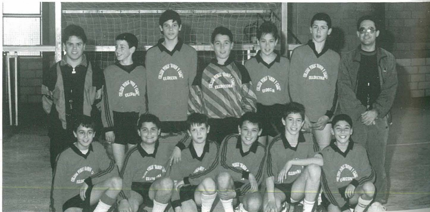
Equip Futbol-Sala Infantil Masculí "A". Campió Comarcal

COMPETICIÓ: Lliga Comarcal CATEGORIA: ALEVÍ MASCULÍ