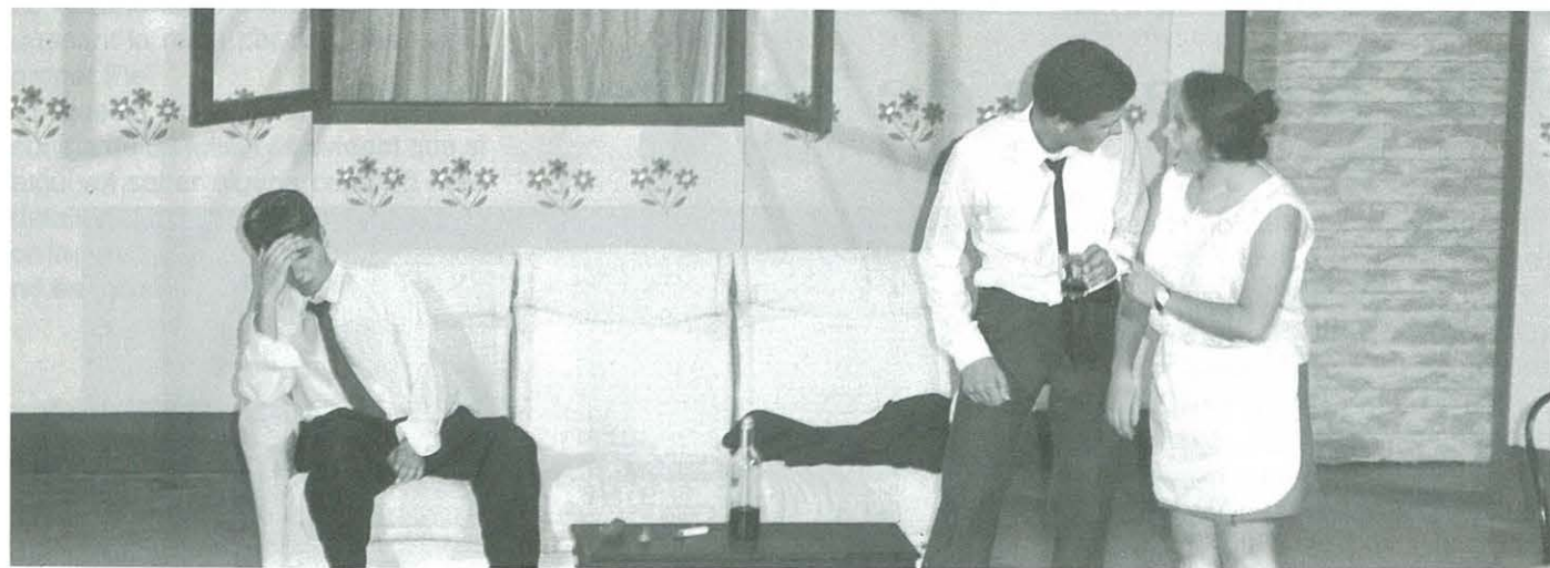
C.C.R. Grup Juvenil " La Pepeta no és morta ". 10-setembre-95