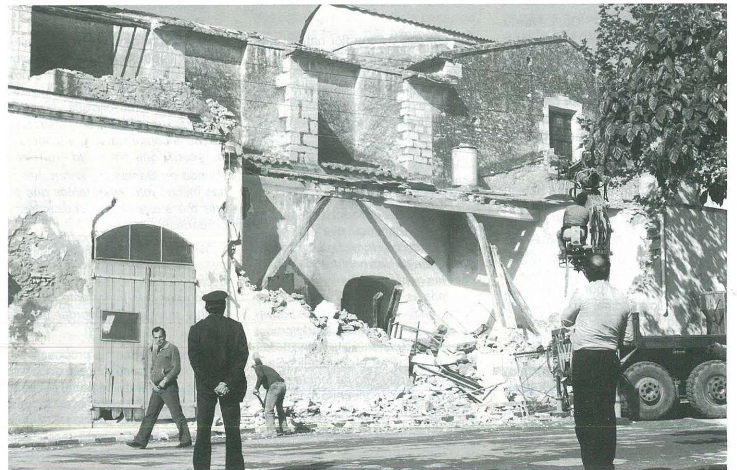
Inici d'Obres de la Casa de Cultura. Demolició de peixateries i escorxadors.