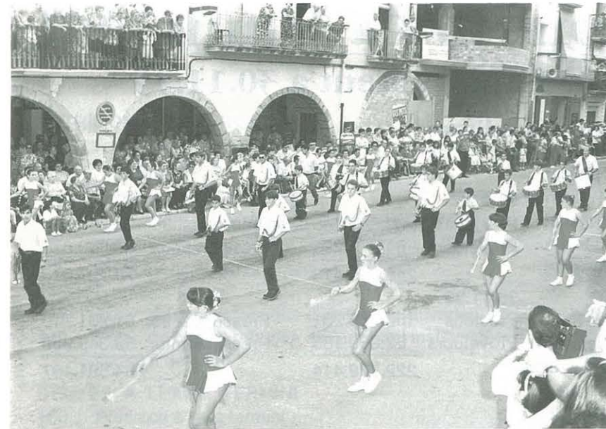
Majorettes i Cornetes i Tambors d'Uldecona