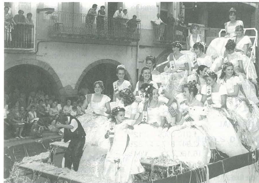
La carrossa més florida al seu pas per la Plaça