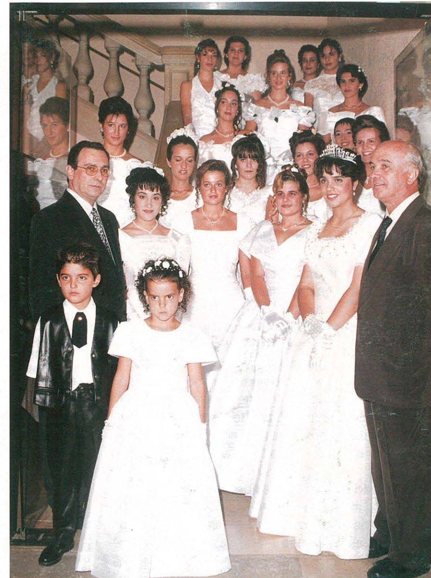
Festa Major 1995