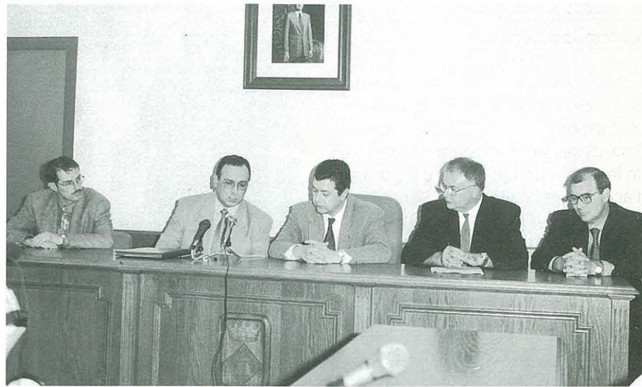
Rebuda al Conseller Pujals al Saló de Plens

Finalment el passat dia 23 d'octubre va tenir lloc la inauguració oficial de l'Institut, amb la presència de les autoritats locals i del conseller d'Ensenyament Sr. Pujals, acompanyat d'autoritats comarcals i membres del Departament d'Ensenyament.