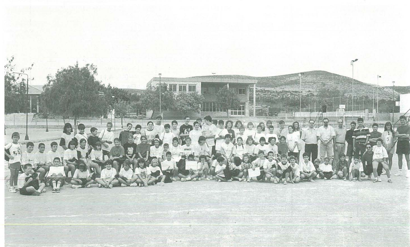
Escoles d'Iniciació Esportiva. Estiu '95. Festa Final