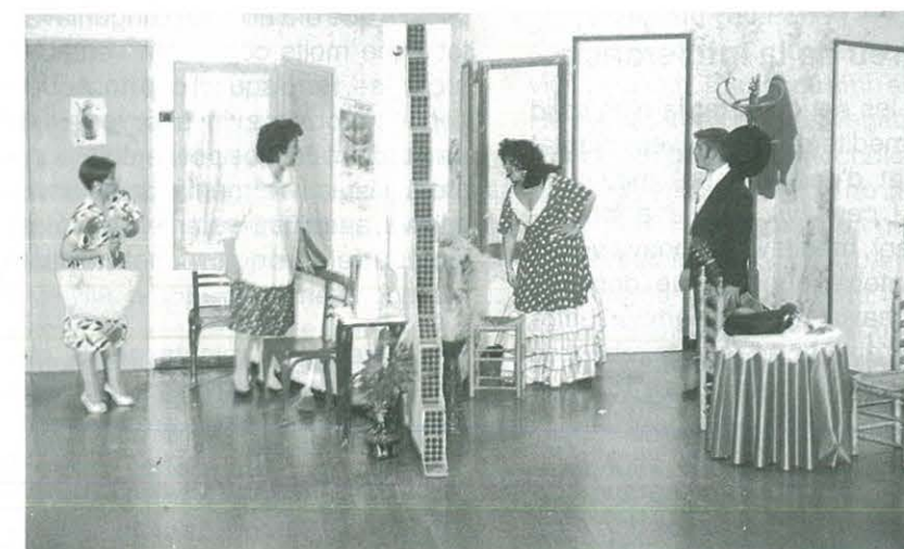
XIII Jornades de Teatre 1995 8 d'octubre, "La Tramoia" de Santpedor, obra Majorica de Cesc Fortesa