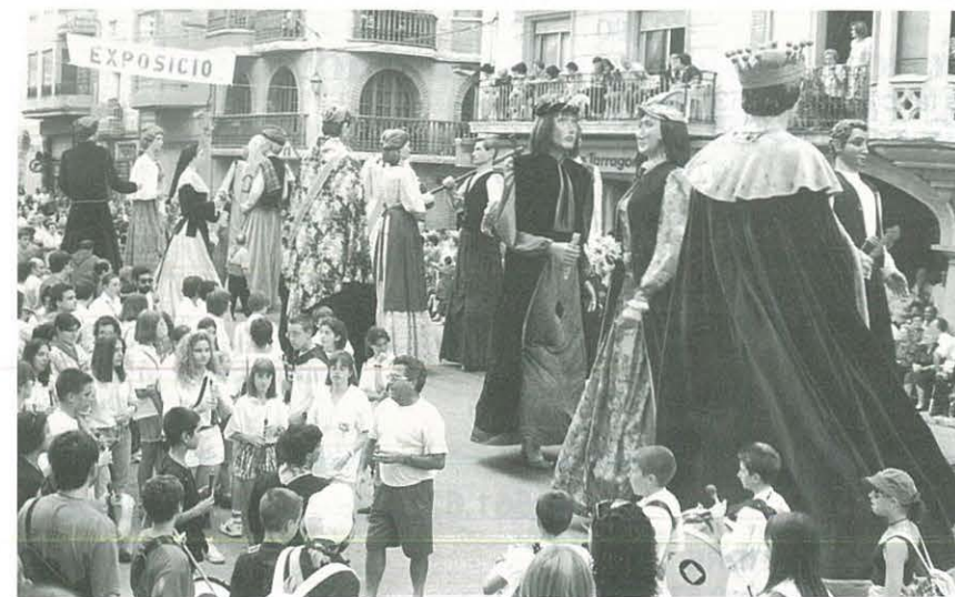
La Trobada Gegantera