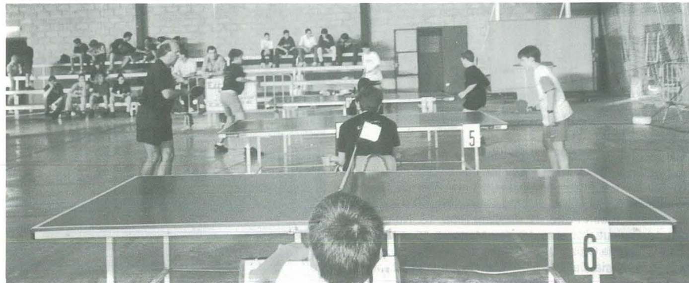
Is. XII Hores de Tennis de Taula Ulldescona

Servei Municipal d'Esports de l'Ajuntament d'Ulldescona. Col.legi Públic Ramon i Cajal d'Ulldescona.