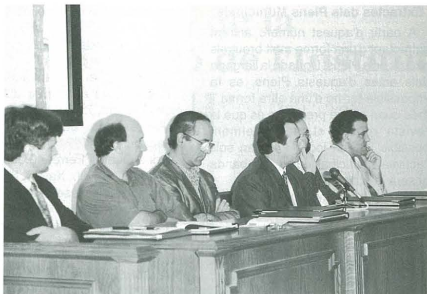
Ple de Constitució de l'Ajuntament. Juny-1991.

Punt 11. Conveni amb el Departament de Medi Ambient per a control emissions gasos de vehicles.