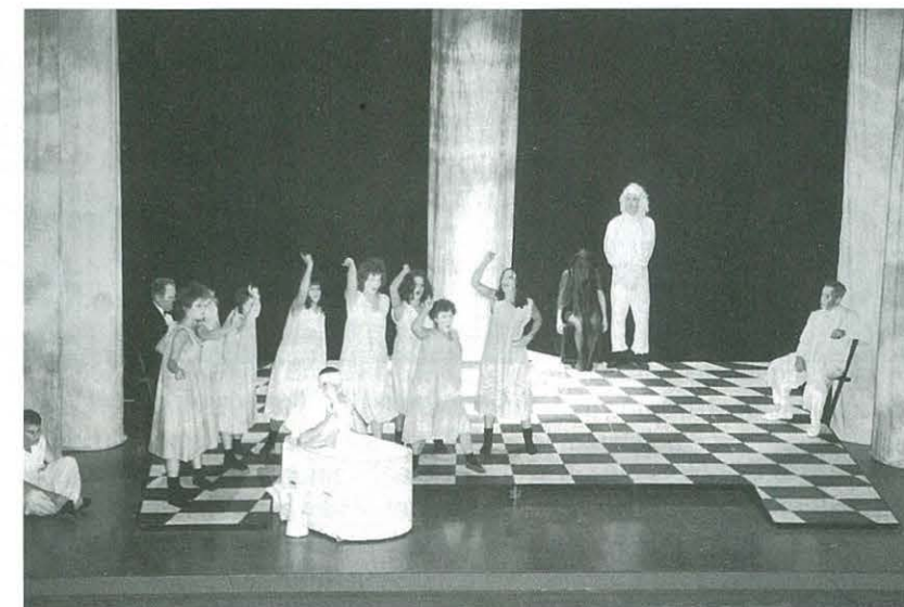
XIII Jornades de Teatre d'Ulldecona "El Coverol" de les Franqueses (Granollers). "Marat-Sade", 1-10-95.

Amb el segon diumenge 8 d'octubre, l'assistència de públic va augmentar, el primer diumenge van ser presents unes dues-centes persones, ja aquest 8 d'octubre amb l'obra "MAJÒRICA" del grup "La Tramoia" de Santpedor, el públic es va doblar i van gaudir i riure molt unes quatre-centes persones. Crec que en aquest cas s'ha de valorar molt, l'esforç d'aquest grup