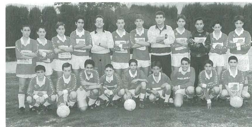
Infantil del C.F. Ulldescona 94-95.

Esport: Futbol Sala Categoria: Cadet-Masculí Equip (A), 3 - Equip (B), 5