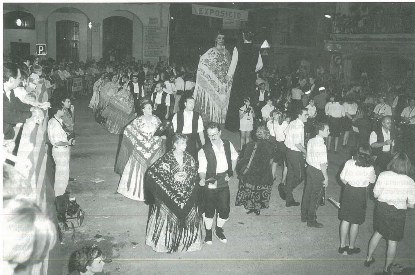
Una vista de l'emblemàtic "Ball de Mantons" tan participatiu com sempre