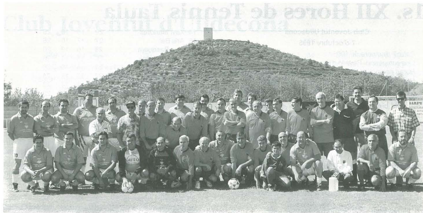
Un interessant i emotiu partit de Veterans...