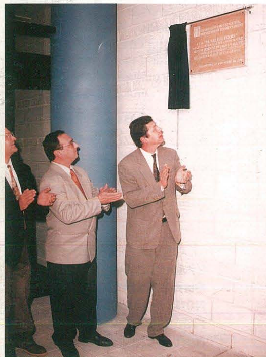
Inauguració de l'Institut