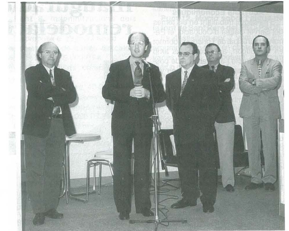
Parlament d'inauguració de la Fira

Les Festes Majors de setembre i les de St. Lluç han marcat sens dubte