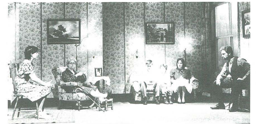
Perduts a Youkers de Neil Simon, pel grup de teatre "L'Escotilló"