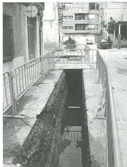
Obres de la xarxa de pluvials

D'acord amb les seves indicacions es va procedir en les negociacions amb els responsables del Departament d'Ensenyament, si bé encara no es té una resposta definitiva i cal