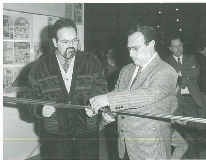
Acte d'inauguració del Parc