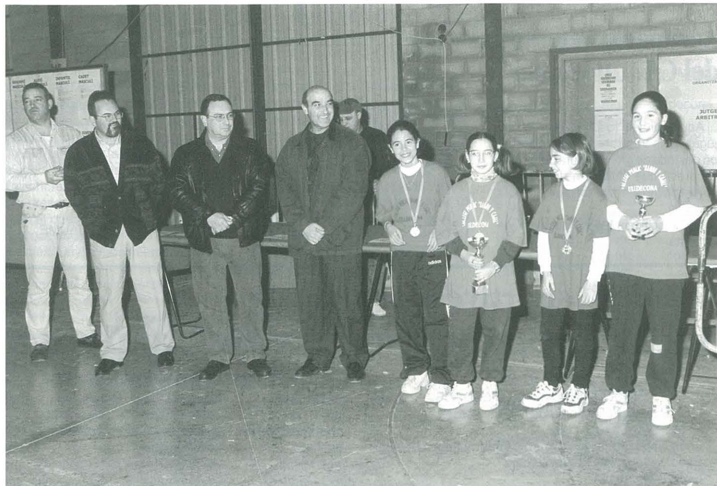
Finals Comarcals T.T. Ulldesona. Equip aleví femení. Campiones Comarcals curs 97/98 dels Jocs Esportius Escolars de Catalunya