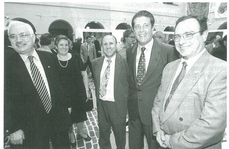
Sr. Federico Mayor Zaragoza, director general de la Unesco, amb el Sr. Lluç Raga

El passat dia 16 de desembre va visitar el conjunt d'abrics d'art rupestre d'Ulldecona un comissionat de la Unesco, acompanyat per l'alcalde i altres membres del consistori, així com per l'alcalde de Freginals. L'arqueòleg francès de la institució, Josep Clottes és conseller d'art rupestre del Ministeri de Cultura del Govern francès i director de la secció de Prehistòria del museu de la regió del Midi-Pirinées. La Unesco li ha encarregat de conèixer tot el fons documental i els conjunts d'abrics més significatius de l'art rupestre de l'arc mediterrani de la península Ibèrica, per informar respecte a la sol.licitud de ser reconeguts com a Patrimoni de la Humanitat.