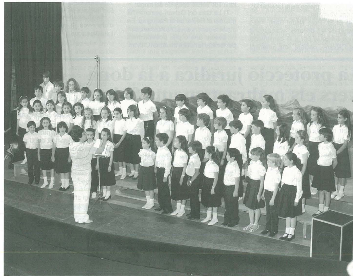
1r concert a Uldecona (6 juny 1983)

Esperem gaudir amb les nostres actuacions i si voleu col·laborar amb nosaltres, feu-vos socis d'"Els Rossinyols del Montsià".