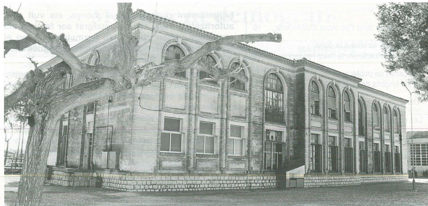
Edifici antic de les escoles

S'han donat instruccions als serveis tècnics municipals, perquè vagin redactant modificacions puntuals de la nostra normativa urbanística, la qual va ser redactada i aprovada al 1992 amb gran quantitat d'error i deficiències.