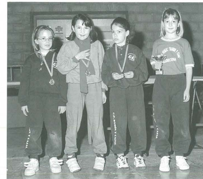
F. Comarcal T.T. Ulldecona (Curs 97-98). Categoria: Prebenjamí femení i benjamí femení. Quatre primeres classificades