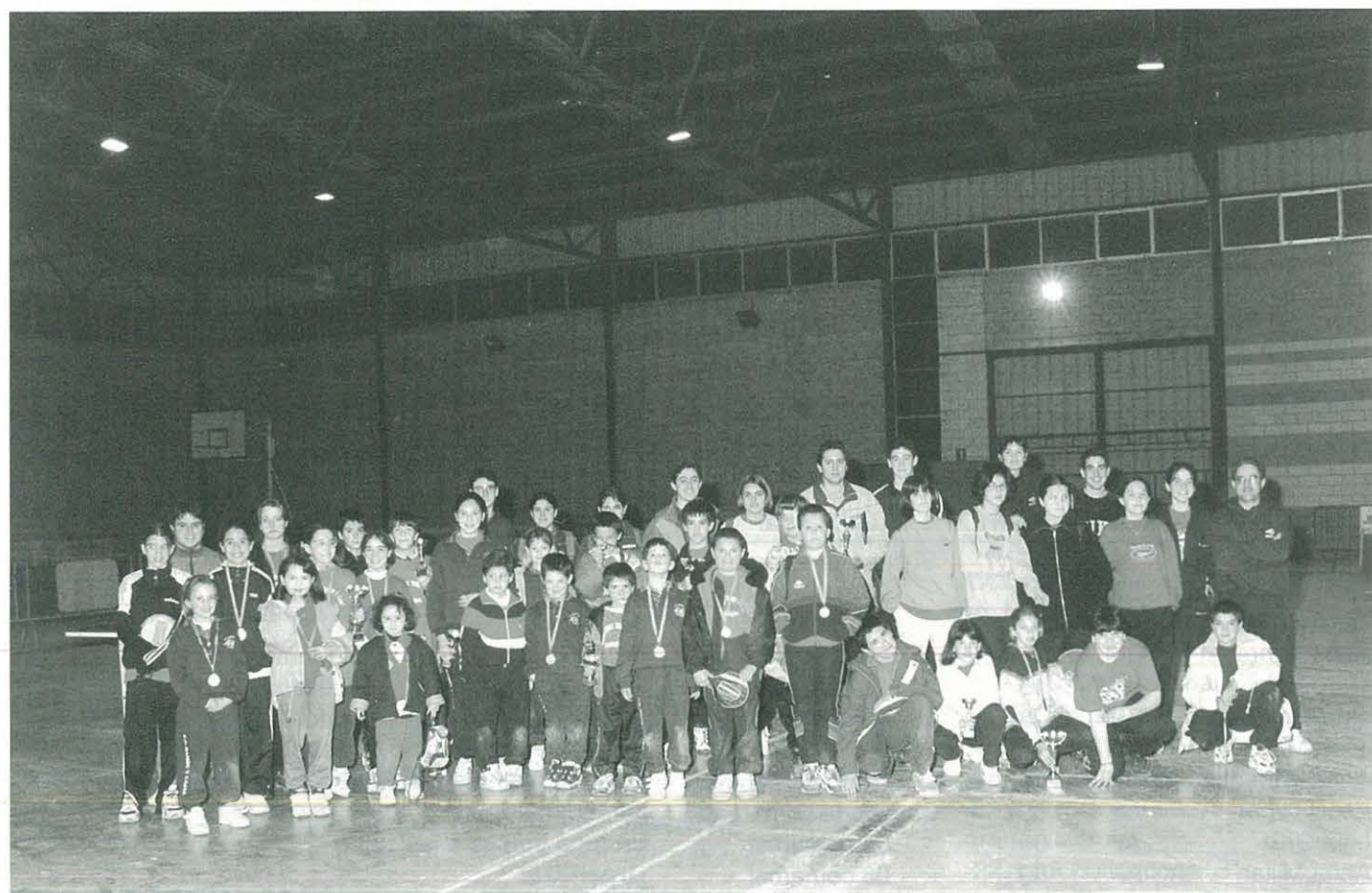
F. Comarcals T. Taula 97-98, Ulldesona. Grup participants Ulldesona