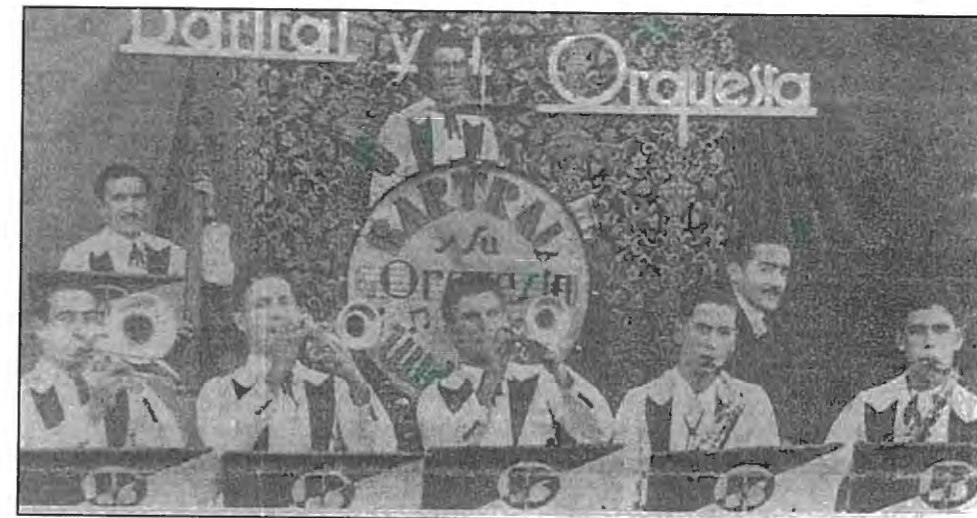
Una imatge de l'Orquestra Bartral