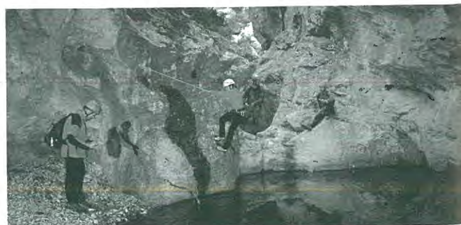
Descens del barranc de la Vallfiguera als Ports. Desembre 2004

Qui estigui interessat a col·laborar en la barra del ball durant l'any 2005 que ho comuniqui a qualsevol membre de la Junta. Necessitem la teva col·laboració!