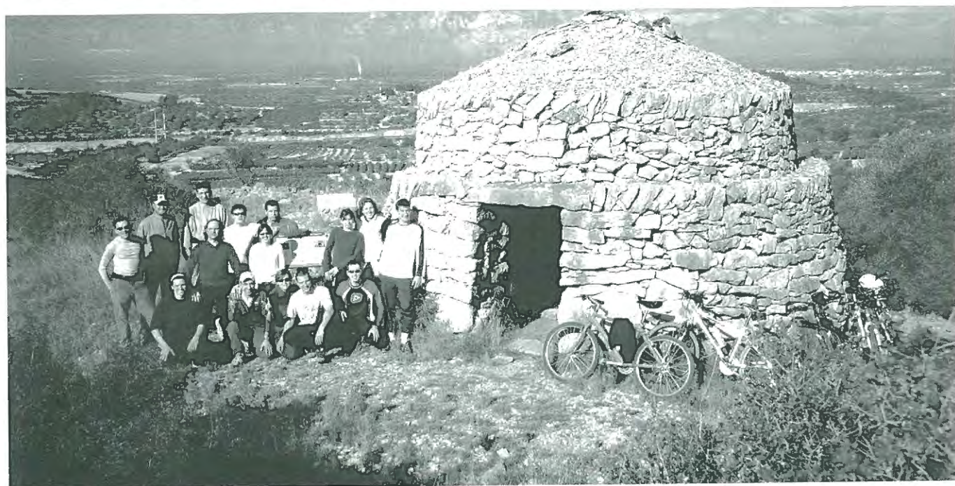
Sortida en bicicleta al Montsià, Freginals i La Serreta. Gener 2005

El Centre Excursionista Uldecona (CEU) podrà modificar la programació per motius de força major. També podrà limitar les inscripcions quan la capacitat de les instal·lacions o dels mitjans de transport així ho aconsellin. Dimarts abans de cada excursió es farà la inscripció corresponent.